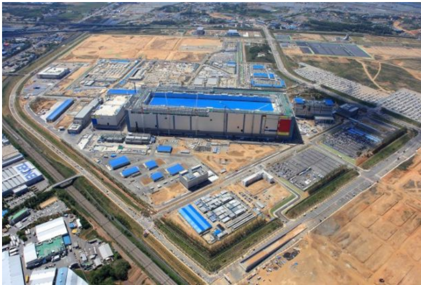
삼성전자 평택 반도체 단지 항공사진.